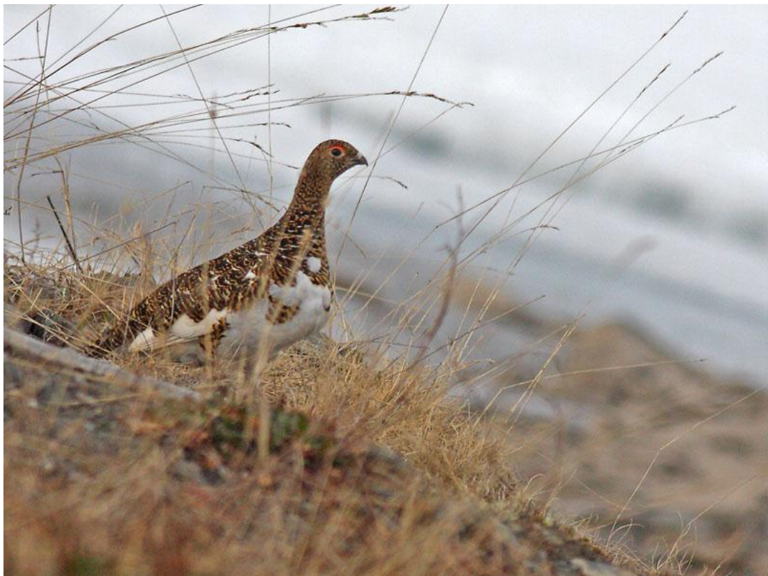
שכווי אירופי, היא, ורנגר, נורבגיה, 3/6.