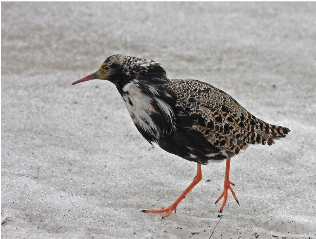
לוחם "רוקד" על פני השלג הנמס, ורנגר, נורבגיה, 4/6.