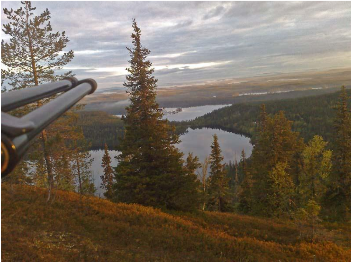
הנוף הנשקף ממרומי הפסגה הדרומית של Valtavaara.