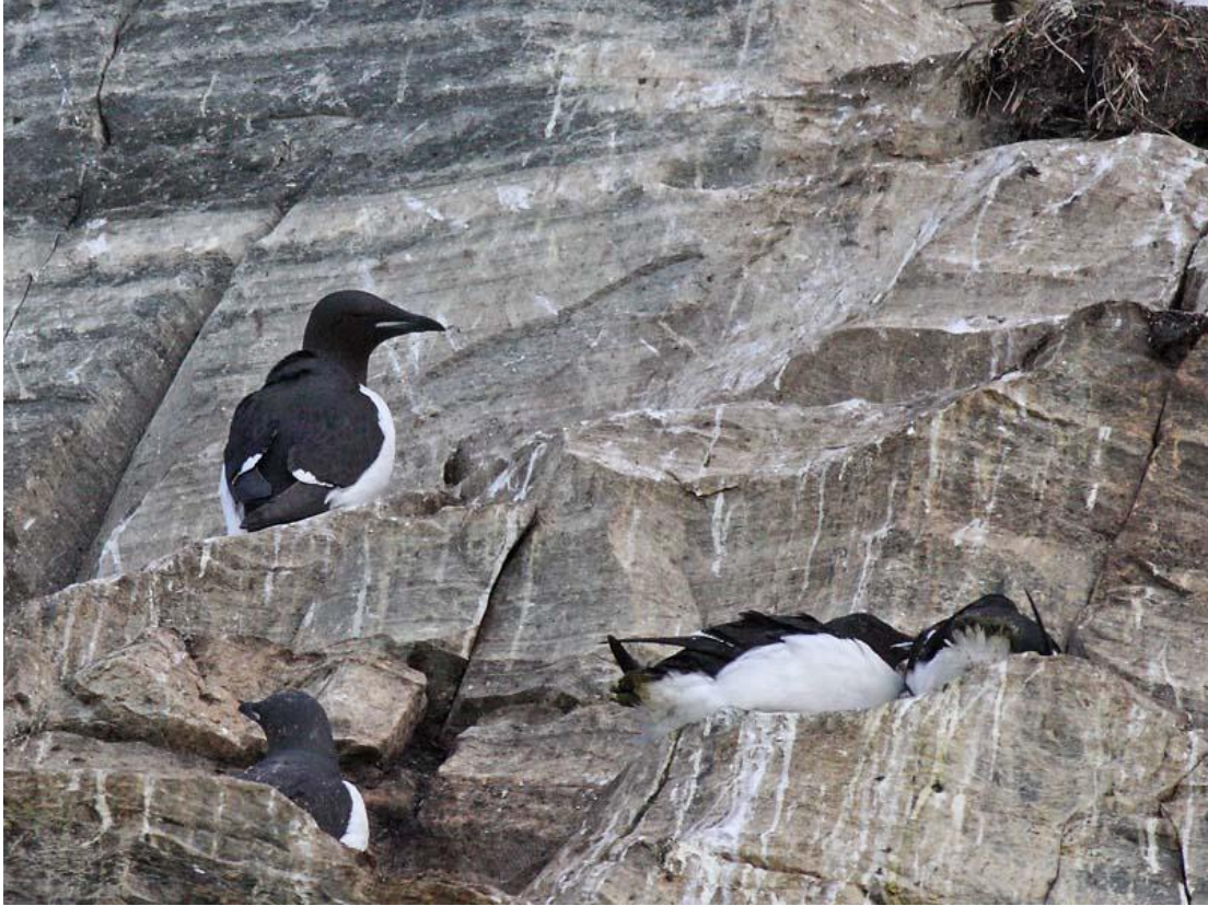
אוריה חייכנית, Hornoya Island, ורנגר, נורבגיה, 2/6.

נצפו על ומסביב לאי Hornoya שם הן מקננות – המושבה על האי מונה עד 400 זוגות. אנחנו צפינו בכמה עשרות פרטים.