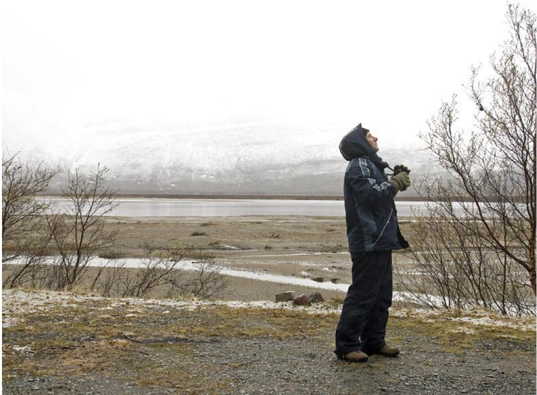
הפוך גוטה, הפוך. הנוף ממול ל"מצוק הבזים". בתווך נהר Tana.