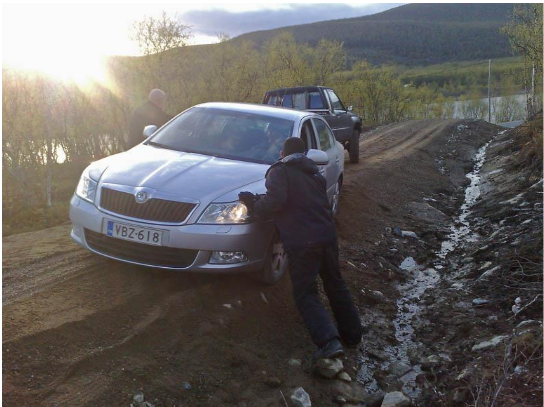
רמי, אתה באמת מאמין שתצליח לעצור החלקה של הרכב לתעלה? אופטימי עאלק.