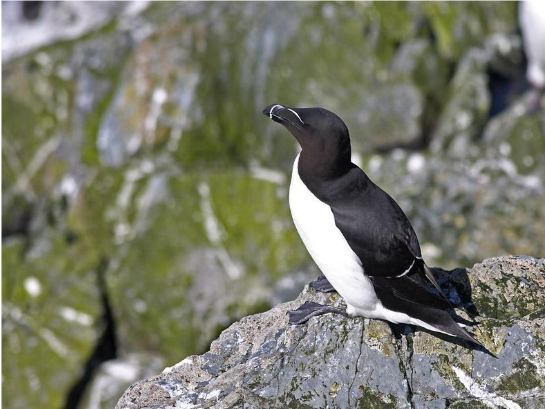
אלקה, Hornoya Island, ורנגר, נורבגיה, 2/6.

בדומה לאוריה החייכנית, גם את המין הזה ראינו רק על האי Hornoya, אם כי במספרים גדולים יותר, סדר גודל של מאות פרטים. האוכלוסייה המקננת על Hornoya מונה כחמש מאות זוגות.