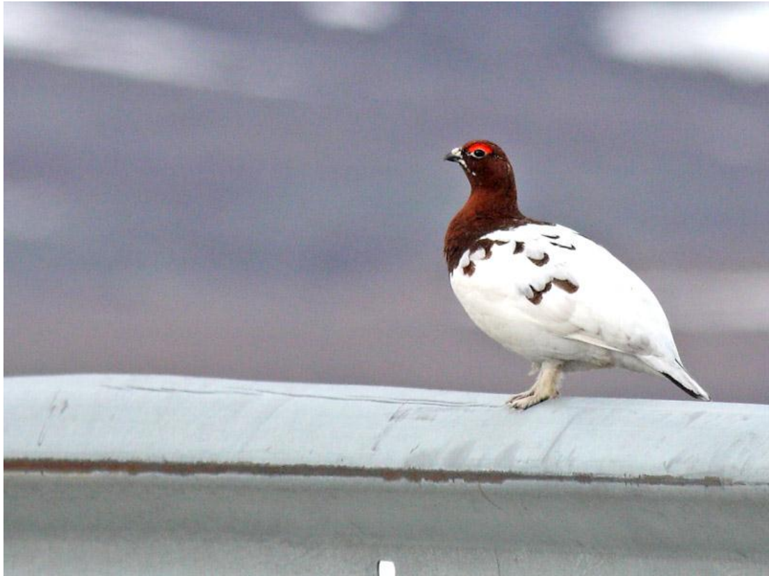
שכווי אירופי, הוא, ורנגר, נורבגיה, 3/6.