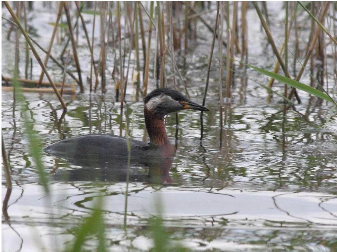
טבלן אפור לחיים, Kemeri N.P, לטביה, 7/6.

הצפי היה לפגוש את הטבלנים באזור Kuusamo, ואכן, בתאריך 30/5, זמן קצר לאחר שהתחלנו לסרוק את האגמים לאורך כביש E63-5, מקמפינג Viipus צפונה וצפון מערבה, איתרנו שני פרטים משייטים להם להנאתם באחד האגמים. לאחר התצפית הזו לא התאמצנו יותר מדי לחפש פרטים נוספים באזור. פרט נוסף נראה ביום האחרון של הטיוול ב-Kemeri N.P.