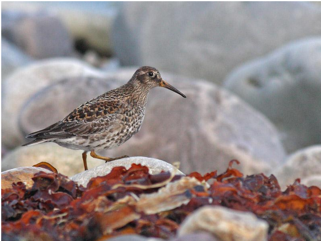
חופית ימית, Salttgern, ורנגר, נורבגיה, 1/6.

נראתה בורנגר, במקום אחד בלבד – על חוף הפיורד, באזור הסלעים של Salttgern (8 ק"מ מזרחית ל-Vadso). נצפו במקום 10 פרטים.