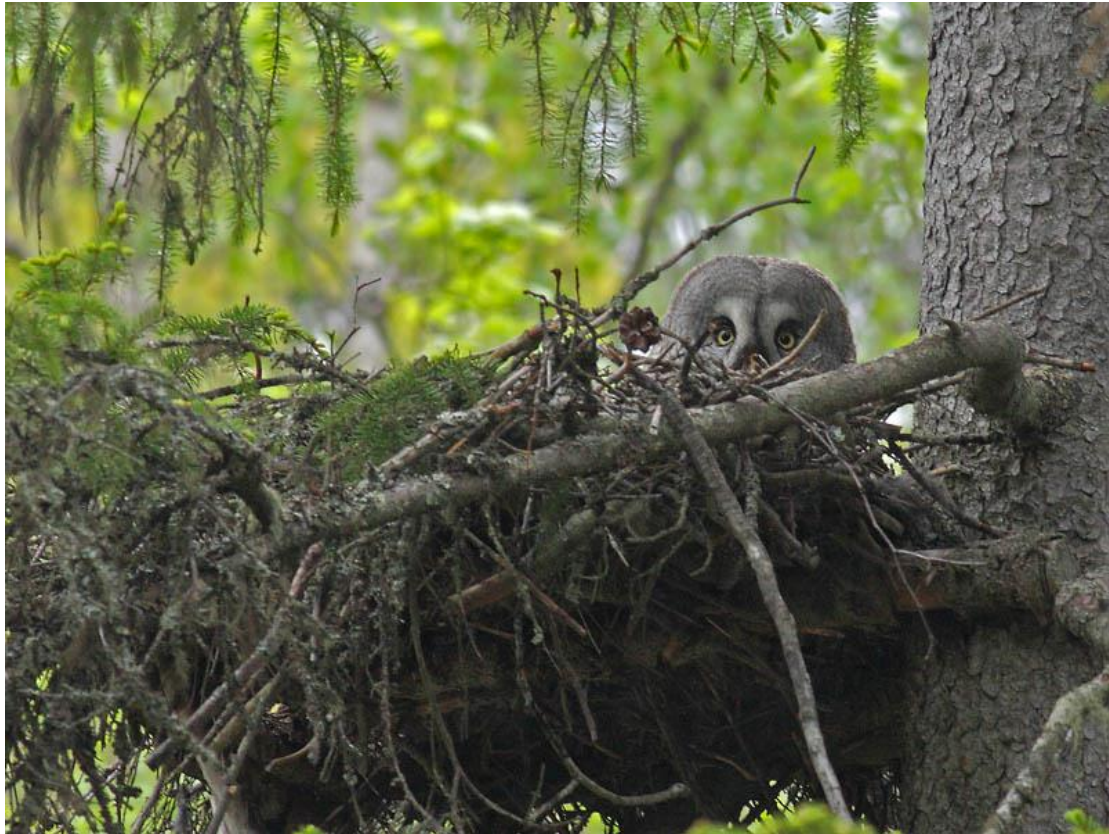
לילית אפורה (נקבה?) בדגירה, אזור Kemi, פינלנד, 29/5.