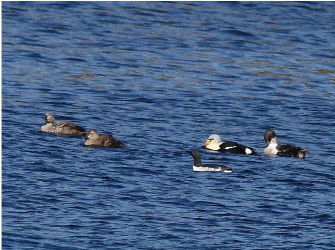
4 אדריות מלכותיות + אוריה מצויה, Hornoya Island, ורנגר, נורבגיה, 2/6.

נצפו אך ורק בורנגר, בשני מקומות, Hornoya ו-Hamningberg כאשר הריכוז הגדול ביותר נצפה באזור Hornoya - במים המפרידים בין האי הזה לאי הסמוך (Reinoya) שחו המוני עופות מים: אדריות שחורות כיפה, אלקות, אוריות מצויות וחייכניות והיד עוד נטויה. בין שלל עופות המים שחו להם בגאון כשלושים אדריות מלכותיות, מתוכם שלושה זכרים בוגרים, היתר נקבות וצעירים. קבוצה נוספת של עשרה פרטים נצפתה ב-Hamningberg.