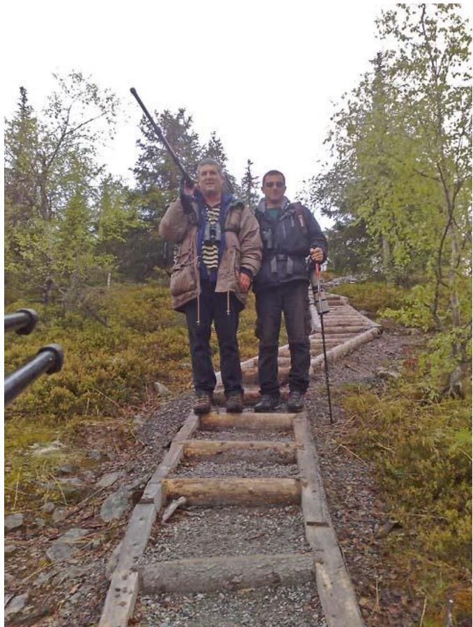
יורדים מ- Valtavaara מלאי אושר אחרי שנתנו לכחול זנב בראש.