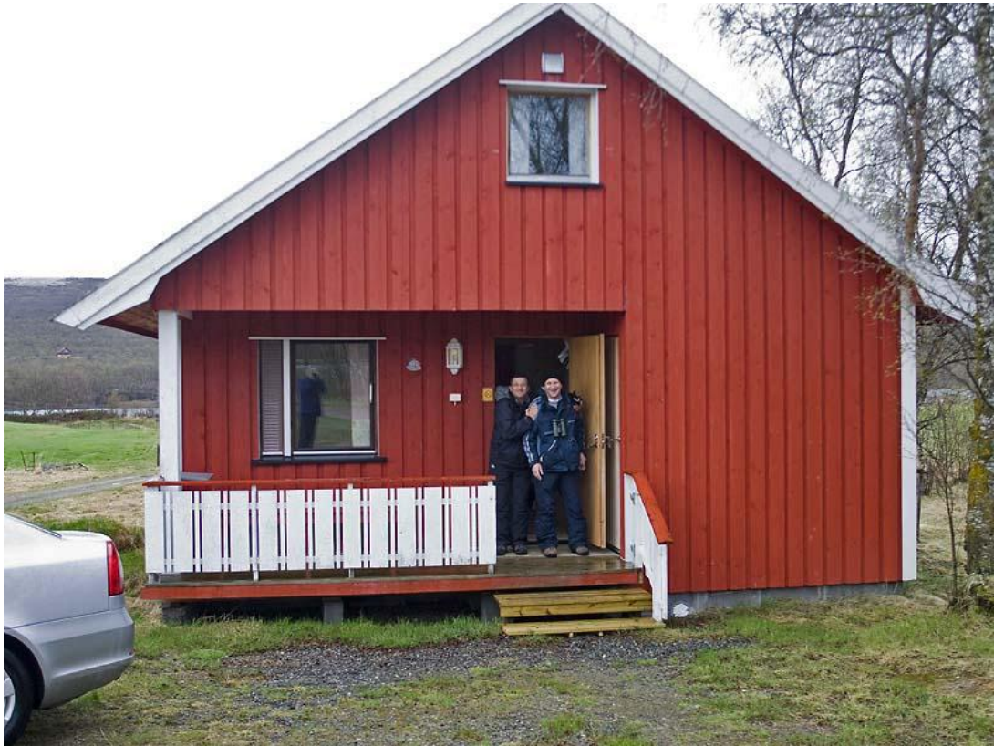
קר בחוץ וחם בבית - מחויכים על הבוקר בפתח הבקתה ב- Garcovarri. 1 ליוני – נורבגיה - Vardo - לינה באוהל לפני הכניסה למנהרה המובילה ל- Vardo . ללא תשלום;