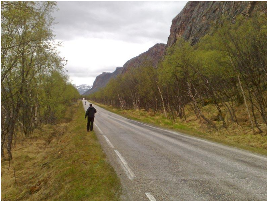
מחפשים את (בז) הצפון. "מצוק הבזים", אזור Tana bru.

1/6 – נורבגיה – ורנגר: התחלנו את היום בשעה 0500 ב"מצוק הבזים", כ- 30 ק"מ צפונית ל- Tana bru. צפרים בריטיים אשר פגשנו במקום דיווחו לנו כי מצאו קינון של עלווית צפונית בקרבת רחבת הכנסייה של Neiden , מקום אשר לא תכננו להגיע אליו. לאחר התייעצות קצרה נפל הפור, נוסעים ל- Neiden. צפינו במקום בין השעות 1000-1200. הדרך ל- Neiden רצופה מפרצים רבים, ושווה להשקיע בהם הרבה יותר זמן מהזמן שאנחנו השקענו. חזרה ל- Varangerbotn ונסיעה עד Vardo עם עצירות ביניים ב: Store Ekkeroy , Saltjern , Vadsøya Island , Vadso , Nesseby Church . בנוסף עצרנו בדרך מידי פעם במפרצים בהם נראה היה שיש פעילות. לינה באוהל ב- Vardo;