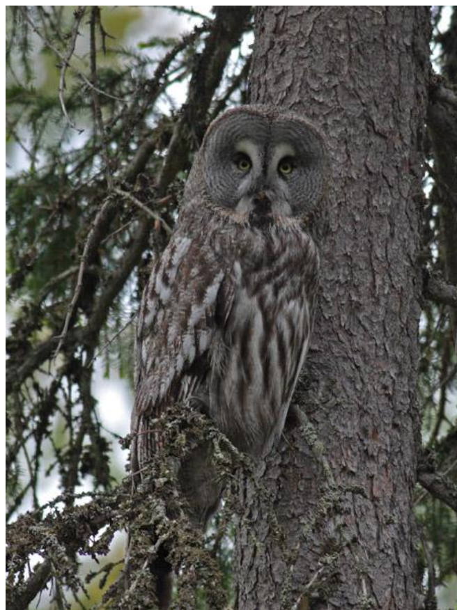
לילית אפורה (זכר?) בקרבת הקן, אזור Kemi, פינלנד, 29/5.