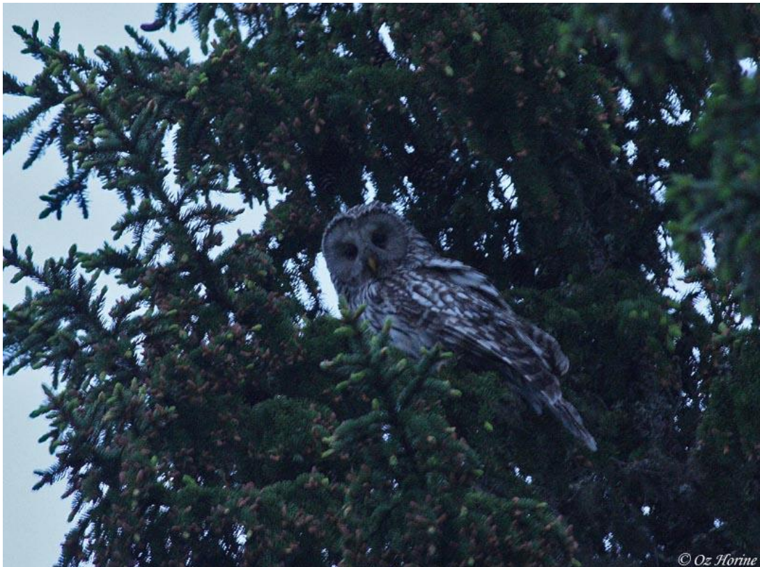
לילית אורל, אזור Oulu, פינלנד, 29/5. צילום: עוז חורין

לפעמים צריך מזל בחיים. לנו היה מזל, הרבה מזל - רק ביום שקדם לסיור שלנו נודע למדריכה שלנו על קיומו של הזוג בו צפינו, בקרבת Oulu. סיורים מודרכים אשר יצאו בימים שקדמו לסיור שלנו, נאלצו לוותר על תצפית בלילית אורל, שכן הטריטוריה הקרובה ביותר הייתה הרבה דרומה ל-Oulu, מרחק אשר לא אפשר תצפית בלילית אורל ובלילית אפורה באותו סיור בשל הזמן המוגבל של הסיור. את הפרט שלנו ראינו כאמור בקרבת Oulu, ביער מחטני, עומד גלוי במרכזו של עץ גבוה. התצפית נעשתה תחת גשם טורדני ונמשכה זמן קצר שכן הפרט בו צפינו החליט משום מה לפרוש כנף ולהיעלם. הספקנו לצלם תמונה או שתיים כרקורד שוט ותו לאו.