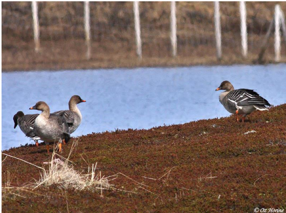
אווז אחו טייגה + טונדרה, שפך נהר Skallelv, ורנגר, נורבגיה, 3/6.

במהלך הטויל פגשנו שלושה/ארבעה מיני אווזים, אפור, לבן מצה ואחו משני מינים/תתי מין, טייגה וטונדרה. להוציא את האווז האפור אשר נצפה הן בפּינלנד והן בנורווגיה (ורנגר) יתר מיני האווזים נצפו רק בורנגר. הריכוז הגדול ביותר של אווזים היה בשפך של נהר Skallelv – בדרכנו חזרה מאזור Hamningberg לכיוון Berlevåg התעכבנו בדלתא אשר בשפך של הנהר. היו במקום 10 אווזים משלושה/ארבעה מינים שונים, כאשר בתוך להקה בת ארבעה אווזי אחו זיהינו שלושה טייגה ואחד טונדרה. בצילום, האווז השני משמאל הנו הטונדרה, היתר טייגה.