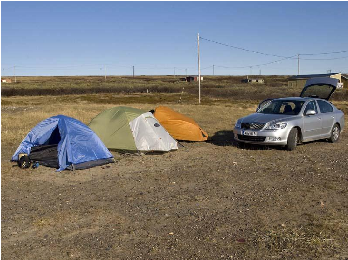
מסדר אוהלים לפני הכניסה ל- Vardo.