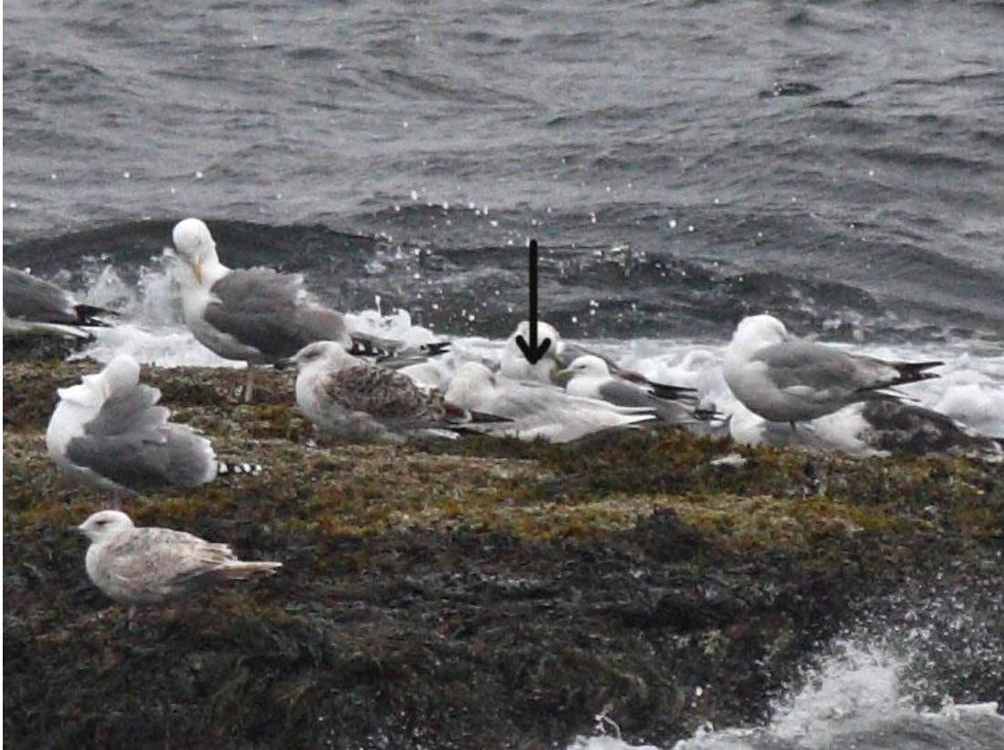
שחף לבן כנף, Berlevåg, ורנגר, נורבגיה, 4/6.

שנה גרועה למין הזה עם מספר מועט של פרטים – צפינו בפרט אחד בלבד בלבוש אביב ראשון בורנגר. נצפה ב- Berlevåg מטווח רחוק, עומד על מזח סלעי הנושק לים ברנץ, ביחד עם עוד כמה עשרות שחפים ממינים שונים (ימי, כספי, ריסות).